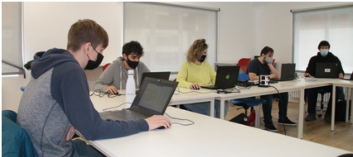
Armeria Eskolako hainbat ikasle eskola-orduetan, martitzenean.

tzu bat eskaintzea ezinbestekoa ikusten dugu. Bailarako sare-enpresariala ereitea eta sustatzea da Meka Lanbide Eskolako apustuetako bat".